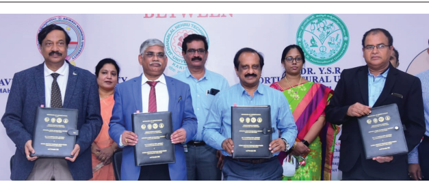
అవగాహన ఒప్పందం కుదుర్చుకుంటున్న వీసీలు