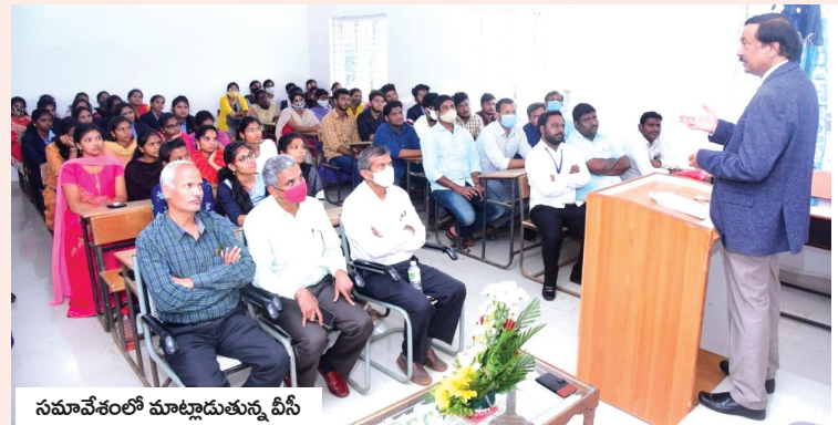
సమావేశంలో మాట్లాడుతున్న వీసీ