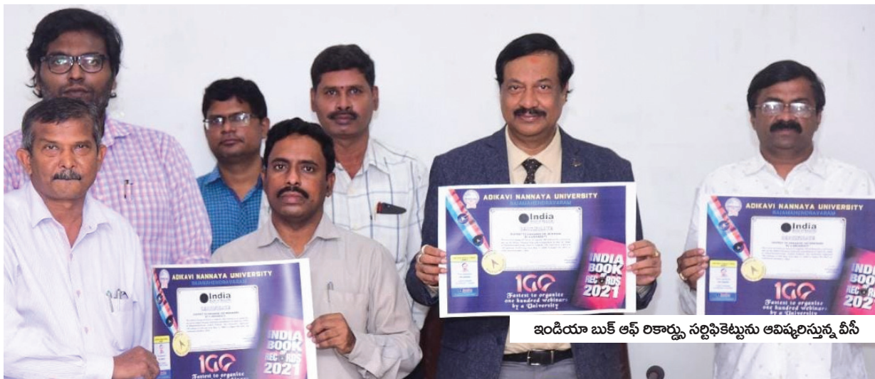
ఇండియా బుక్ ఆఫ్ రికార్డు, సర్టిఫికేట్లను ఆవిష్కరిస్తున్న వీసీ

100 వెబినార్లకు ఇండియా బుక్ ఆఫ్ రికార్డు, ఆసియా బుక్ ఆఫ్ రికార్డు